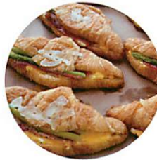
クロワッサンのパニーニ ¥180