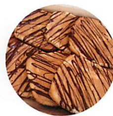
クランチチョコメロン ¥140