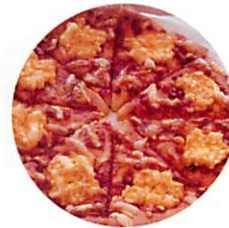
ベーコンエッグピザ ¥150