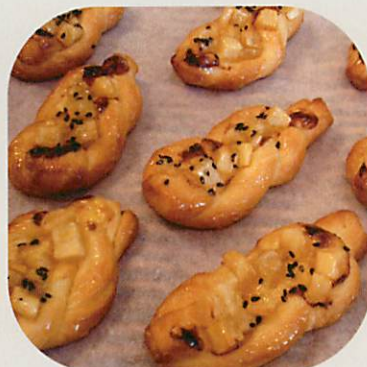
スイートポテトパン ¥80