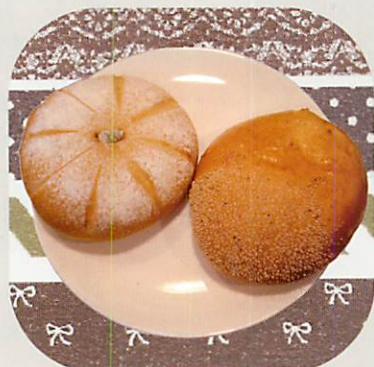
かぼちゃパン&栗あんパン 各¥120