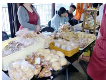
4月27日『ノーマライゼーションフェスタ』