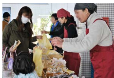
3月27日『元気フェスタ』

にじいろベーカリーは現在、東区保健所、輝栄会病院、河野病院、河野粕屋病院にて定期的に販売させて頂いております。また、平成23年も季節毎に各イベントにて出店・販売予定です。詳しくは日程が決まり次第、店頭にてご案内させていただきます。