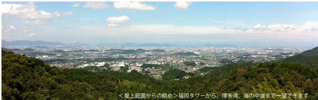
<屋上庭園からの眺め>福岡タワーから、博多湾、海の中道まで一望できます

◀<遊歩道> 遊歩道(既存)を散策したり、ウォーキングしたりして、森林浴もできます。