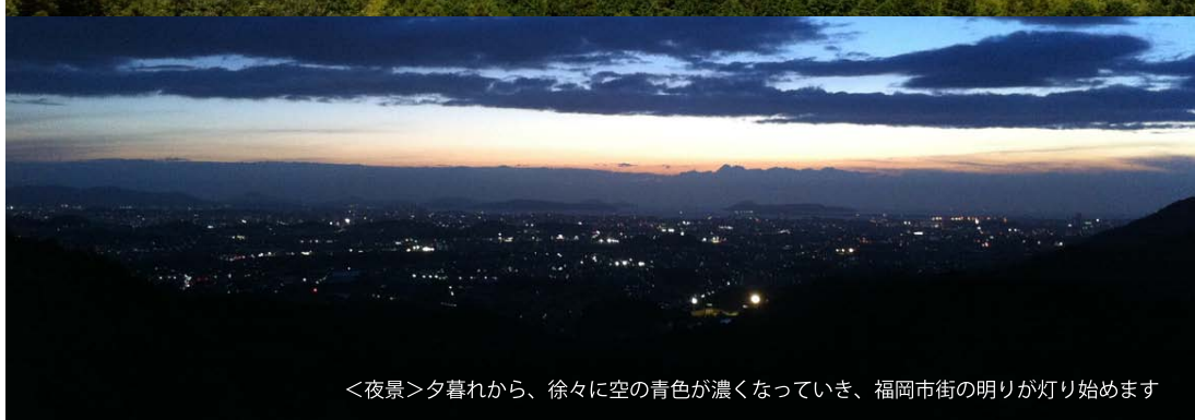
<夜景>夕暮れから、徐々に空の青色が濃くなっていき、福岡市街の明りが灯り始めます