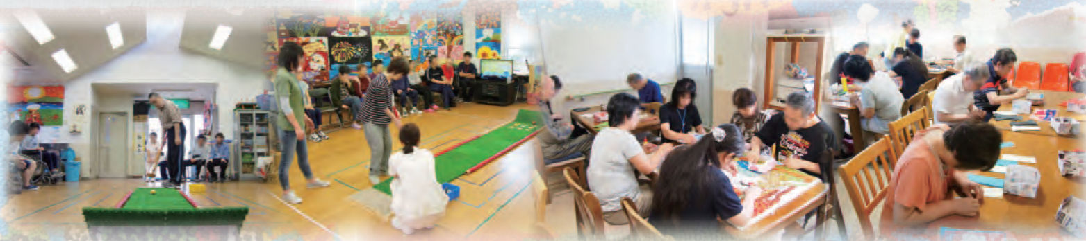
背景の絵は、河野病院の患者さんの作業療法作品です。巻きアートまたはペーパーキリングと呼ばれます。色画用紙を細く切り、クルクルと丸めて貼り付け、1枚の絵として作品にしたものです。(大変、根気のいる作業です。)

河野名島病院は、閉鎖・男性・女性・内科病棟に分かれており、病棟毎に活動計画を大きく変えています。例えば、男性病棟では、甲子園や大相撲などタイムリーなスポーツイベントの話題を取り込んだり、女性病棟は、グループ単位での製作を盛り込んでいます。また閉鎖病棟では、脳の活性化に繋がるように指先多く使う手工芸や脳トレなどを計画しています。一方、内科病棟は患者さんの性質も異なります。入院生活に活力が得れるような事を考えています。例えば、夏祭りや新年会など病院行事の飾りを活動の中で、作成してもらっています。いずれの活動も、患者さん毎にアプローチを変え、全員参加型での活動を目指しています。