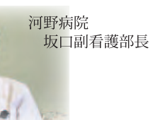
河野病院 坂口副看護部長